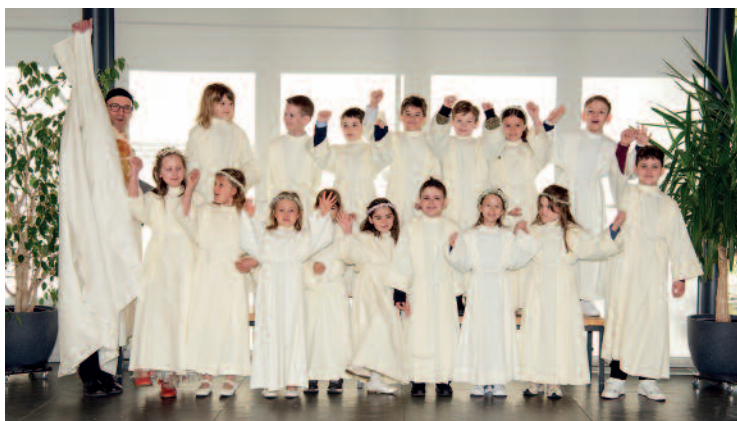
Eko-Kinder VS 2b Rohrbach und Riedenburg