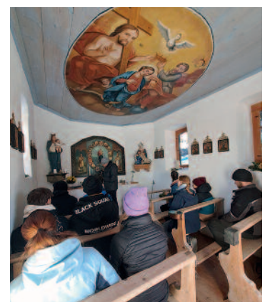
Langer Firmweg 2020-2024