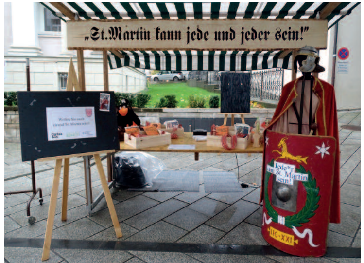
Stand beim Martinimarkt in Dornbirn