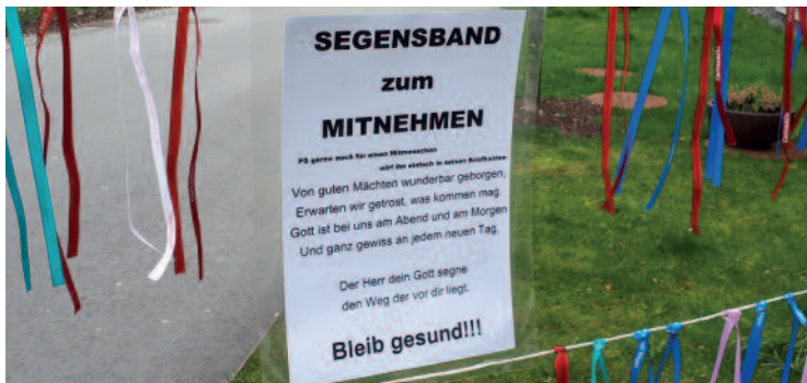
Segensbändchen in der Coronazeit