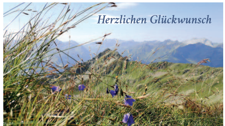
Titelseite Geburtstagskarte, Zamangspitze

In diesem Sinn – freuen Sie sich auf einen netten Besuch, wenn Sie bald einen hohen Geburtstag feiern! Und wenn Sie noch (viel) jünger sind, dann könnte es eine sinnvolle Aufgabe für Sie sein, älteren Menschen Ihrer Pfarre mit einem Besuch Freude zu bereiten. Ihr Pfarrbüro hilft Ihnen gerne weiter, wenn Sie sich engagieren möchten!