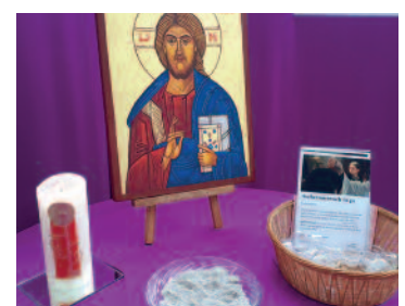
Aschermittwoch to go