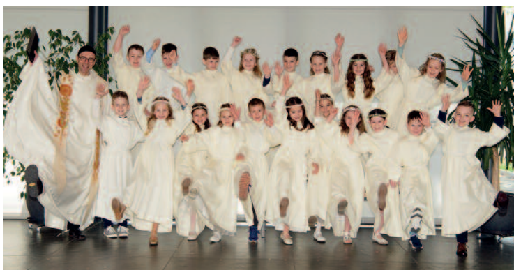
Eko-Kinder VS 2b und 2c Rohrbach

und Klaus, die den EKO-Gottesdienst am Samstag gestaltet haben, beim Musikverein Rohrbach, der an beiden Tagen für die EKO-Kinder und ihre Familien aufgespielt hat und bei den vielen stillen Helfer*innen, die sich sonst noch eingebracht haben. Wieder einmal durften wir als Pfarre ein Ort der guten Begegnung sein.