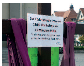
Kreuz am Marktplatz