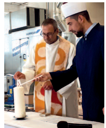
interreligiöser Gottesdienst, Bonettihaus