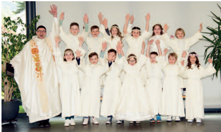
Eko-Kinder VS Fischbach