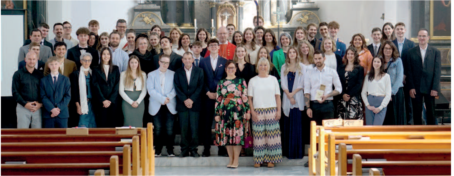
Firmung am 27.04. – Modell Reise

Am 27.04. fand die Firmung vom Modell Reise in der Pfarrkirche Oberdorf mit Firmspender Bischof Benno statt.