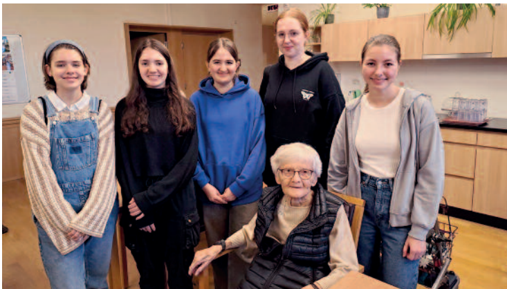
Besuch der Senior*innen im Pflegeheim Birkenwiese