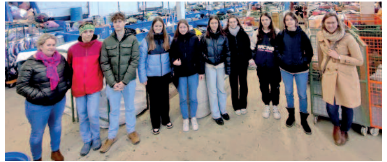
Besuch bei Carlatex in Hohenems