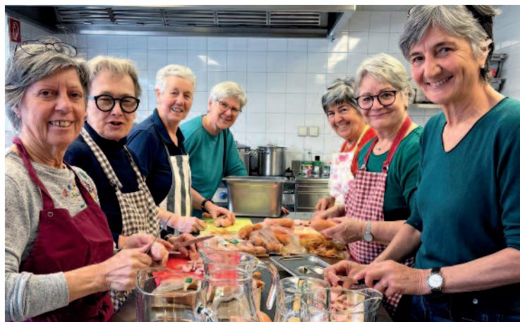
Viele fleißige Hände beim „zämm ko“ im März. Danke an die Frauengruppe „Oase“.